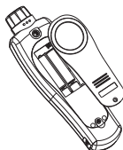
Figure4. Replacing the Battery